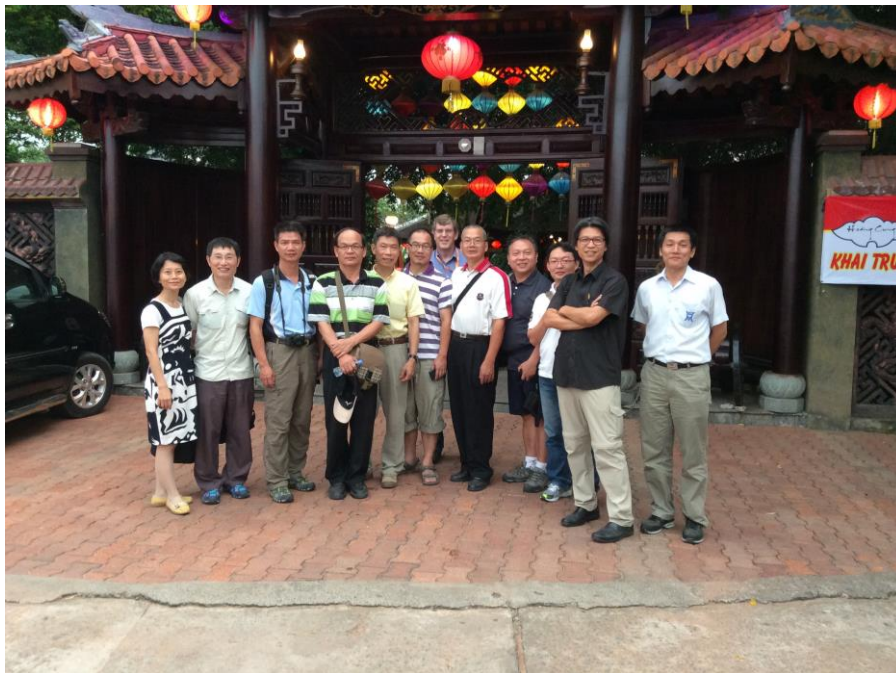
鼎爵實業股份有限公司