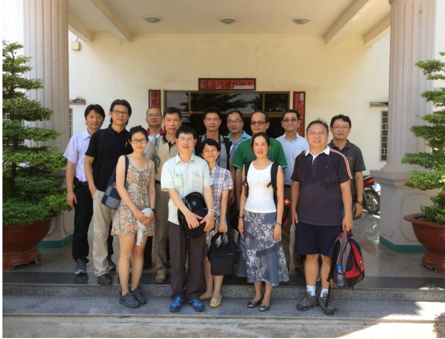
上順家具股份有限公司