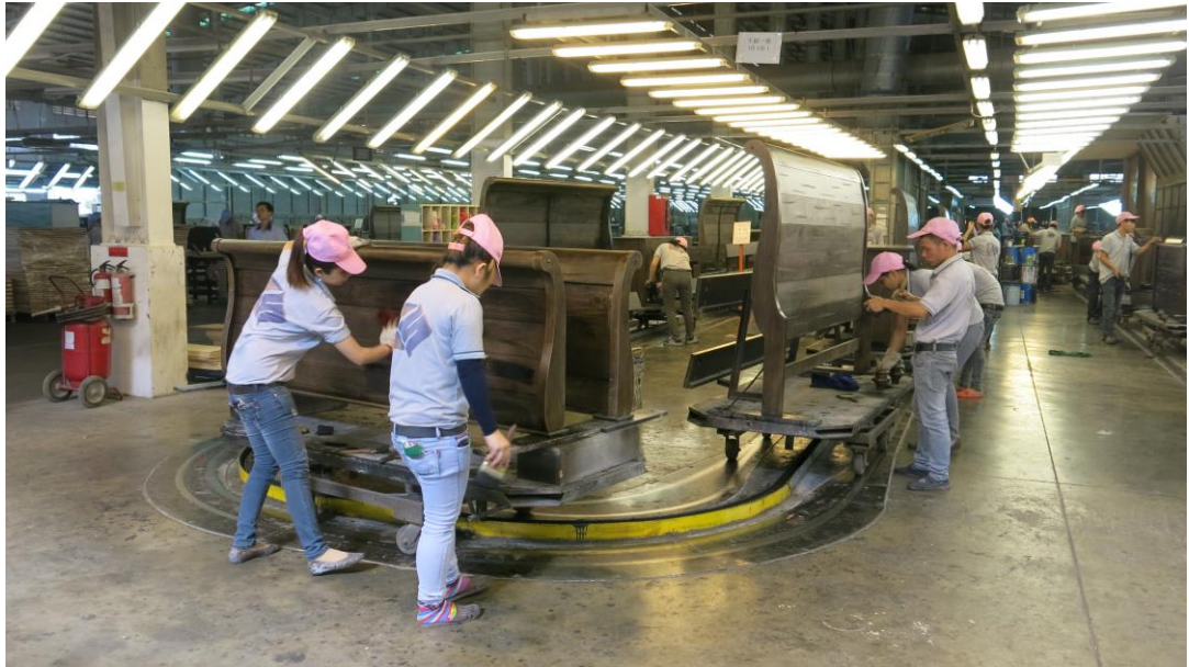
塗裝作業生產線現況