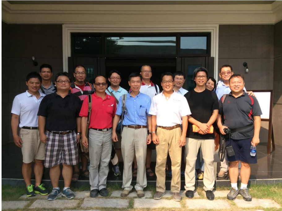
旭陽家具股份有限公司