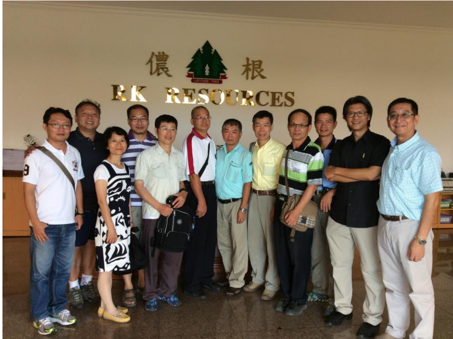
濃根資源股份有限公司