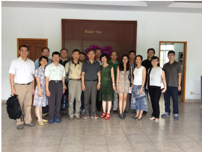
達晟實業股份有限公司