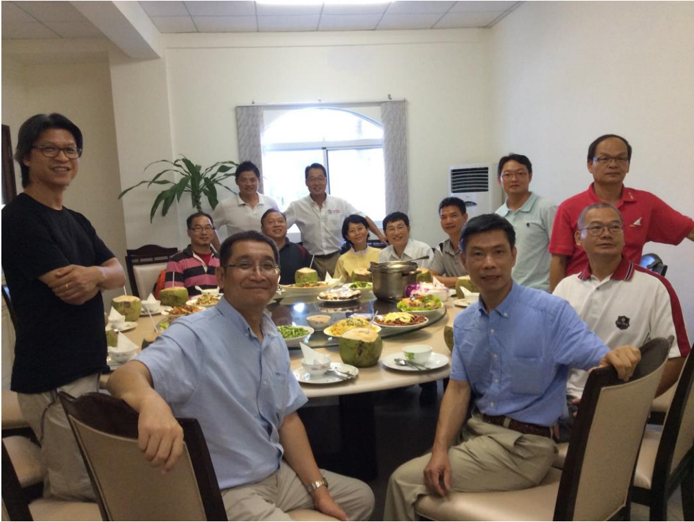
旭陽呂董事長的熱情招待與重視台灣幹部的福利，令人印象深刻