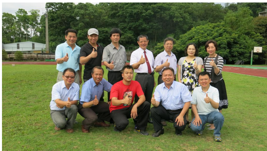
國立大湖農工室設科教學團隊