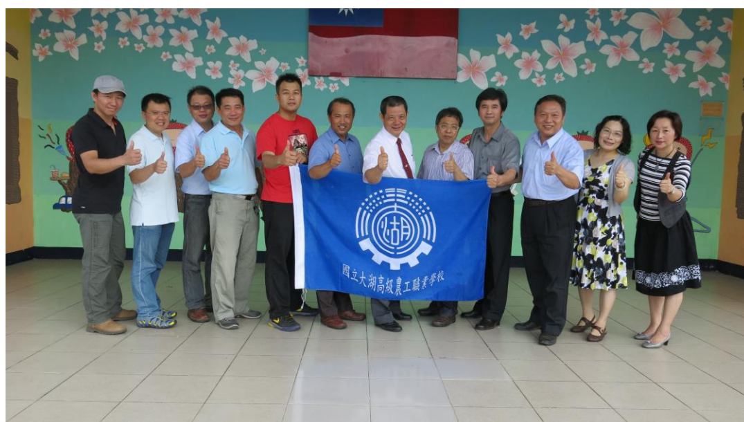
國立大湖農工室設科教學團隊