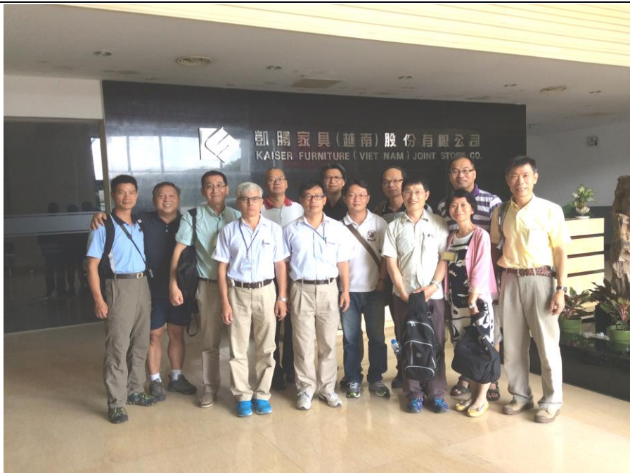
凱勝家具股份有限公司