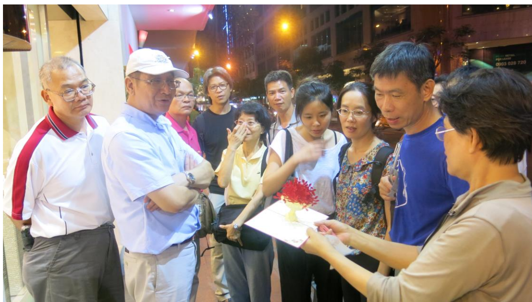
石總於8月16日晚上，帶領台灣教師訪問團至胡志明市參觀（圖為立體卡片）