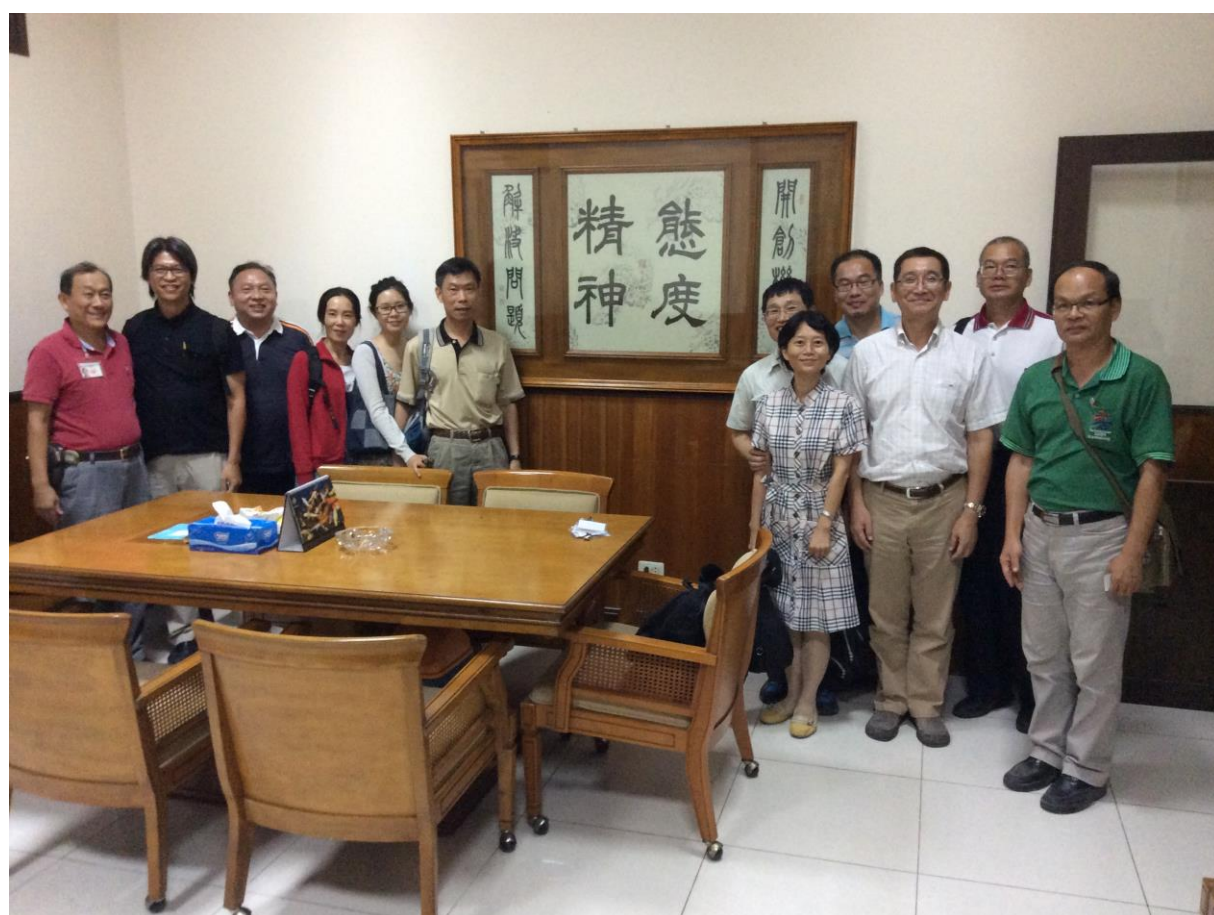
參觀總經理辦公室的墨寶：「態度精神」展現台灣人的海外奮鬥精神