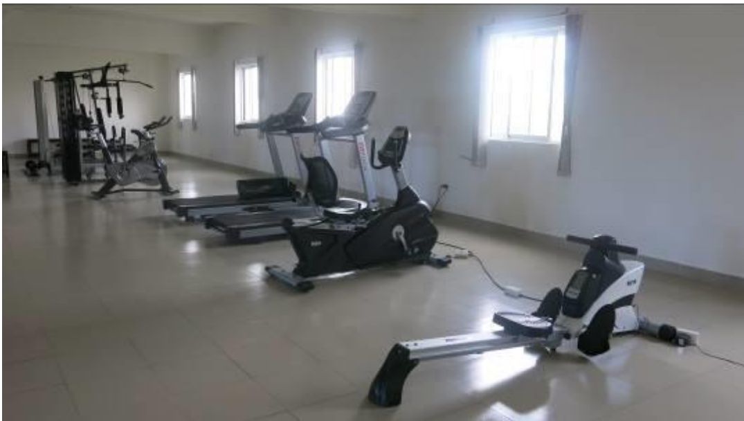
旭陽公司新建員工宿舍大樓，健身器材一應俱全，令人印象深刻