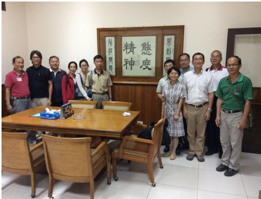
泰合精中家具公司