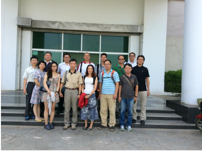
木鄉家具股份有限公司