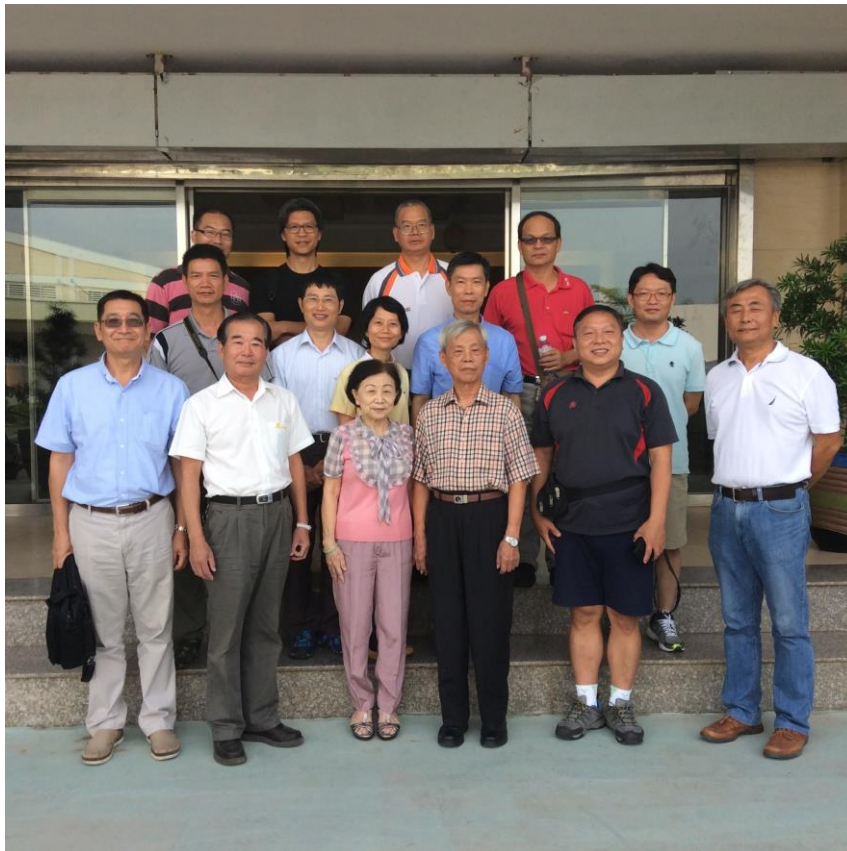
加興興業股份有限公司